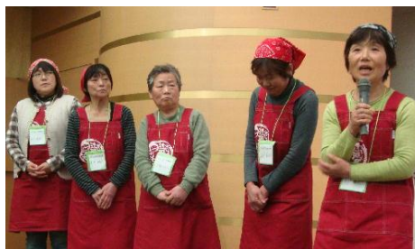
今年の大交流会の時の母ちゃんズのみなさん